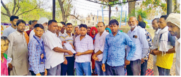
भूना। ज्ञापन सौंपते तीसरा मोर्चा टीम के सदस्य।