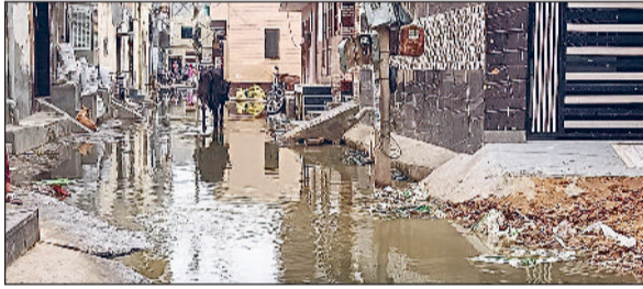
हिंसा। ढाणी श्यामलाल की गलियों में जमा सीवरेज का पानी।

ठप सीवरेज व्यवस्था से परेशान ढाणी श्यामलाल के लोगों ने मंगलवार को नई सब्जी मंडी के सामने मिलगेट रोड जाम कर प्रदर्शन किया। जाम की सूचना मिलने पर संबंधित विभाग के अधिकारी मौके पर पहुंचे और लोगों को शीघ्र समस्या के समाधान का आश्वासन देकर लोगों को शांत करने का प्रयास किया। करीब एक घंटे तक जाम लगा रहने के कारण वहां से आवागमन करने वाले वाहन चालकों को भारी परेशानी उठानी पड़ी। क्षेत्रवासियों का कहना है कि बार-बार जन अधिकारियों से सीवरेज व्यवस्था को ठीक करने की गुहार लगा चुके हैं लेकिन उनकी कोई सुनवाई नहीं हो रही। प्रदर्शनकारियों ने कहा कि क्षेत्र में सीवरेज व्यवस्था का बुरा हाल है