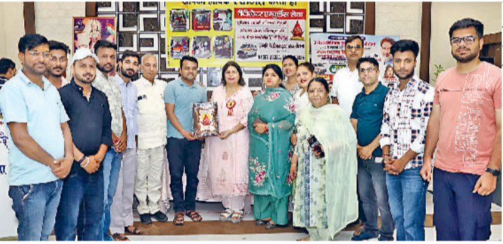
जाखल। श्री श्याम सेवा दल को सम्मानित करते ट्रस्ट के सदस्य। थैलेसीमिया पीड़ित बच्चों के लिए रक्तदान शिविर लगाया। झुग्गी झोपड़ी वाले बच्चों को निःशुल्क पढ़ा रही संस्था।

टोहाना में उम्मीद चेरिटेबल ट्रस्ट के दूसरे स्थापना दिवस पर कार्यक्रम किया गया, जिसमें बड़े स्तर पर रक्तदान शिविर का आयोजन किया गया। इस शिविर में मुख्यातिथि राज्यसभा सांसद सुभाष बराला ने शिरकत की। उम्मीद चेरिटेबल ट्रस्ट के दूसरे स्थापना दिवस के अवसर पर थैलेसीमिया पीड़ित बच्चों के लिए भी रक्तदान शिविर एवं सम्मान समारोह किया गया। इस कार्यक्रम में जाखल की श्री श्याम सेवा दल संस्था को भी आमंत्रित किया गया। कार्यक्रम में उन लोगों को सम्मानित किया गया, जो अनेक बार रक्तदान कर चुके हैं या फिर सर्वाधिक रक्तदान शिविर आयोजन कर चुके