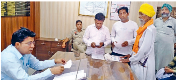
रतिया। समाधान शिविर में लोगों की समस्याएं सुनते एसडीएम।

उपमंडलाधीश जगदीश चन्द्र ने संबंधित अधिकारियों व कर्मचारियों को मौके पर ही समाधान शिविर में शिकायतों का निपटारा करने व अन्य समस्याओं को जल्द हल करने के बारे में निर्देश दिए गए। उन्होंने कहा कि आमजन को सरकार की योजनाओं के बारे में अधिक से अधिक जागरूक करें और योजनाओं का लाभ उठाने के लिए