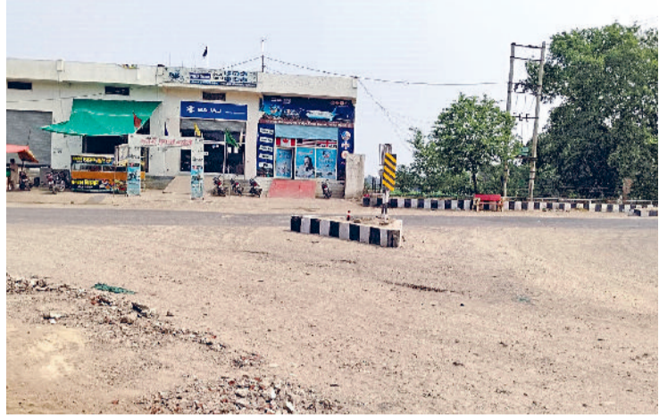
जाखल। कडैल तिराहा, जिसका विभाग कार्यालय करेगा, चंडीगढ़-बुढ़लाडा मार्ग पर बने गड़े।

हरियाणा-पंजाब को जोड़ने वाले जाखल शहर के बीच से विभिन्न शहरों की ओर आवागमन के लिए सफर करने वाले लोगों के लिए एक राहत की खबर है। जाखल शहर के बीच में से गुजरते अति व्यस्त चंडीगढ़-बुढ़लाडा रोड के शहर के अंदर के मार्ग के जल्द ही दिन फिरने वाले हैं। संबंधित अधिकारियों की मानें तो जुलाई के पहले सप्ताह में ही इसका कार्य प्रारंभ हो जाएगा। ऐसे में इसी वर्ष इसका कार्य मुकम्मल होने से वाहन चालकों को वर्ष के अंत तक जाखल शहर में लगने वाले जाम से राहत मिलने लगेगी। बता दें कि लोक निर्माण विभाग द्वारा 60 करोड़ रुपए से निविदा जारी कर सुरेवाला चौक से टोहाना के हरियाणा-पंजाब के बॉर्डर पर निर्माण किए जा रहे 30.14 किमी