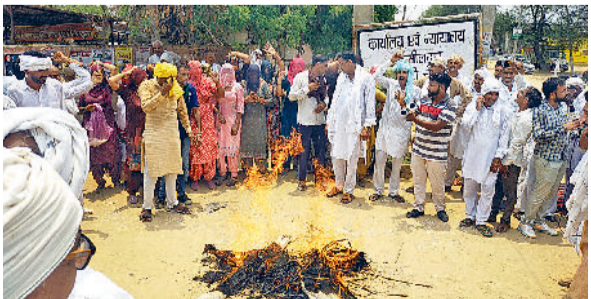
सिरसा। चोपटा तहसील कार्यालय के सामने पुतला फूंकते ग्रामीण।