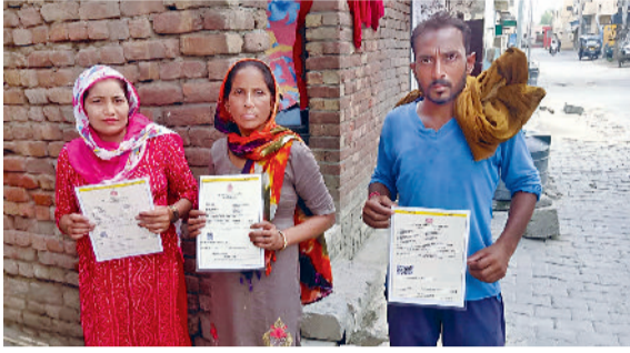
जाखल। राशन डिपो से मिलने वाले तेल से वंचित लोग अपनी समस्या रखते हुए।

जून महीना खत्म होने में अब मात्र चार दिन शेष बचे हैं, इसके बावजूद अभी तक राशन डिपो पर सरसों के तेल की पर्याप्त आपूर्ति नहीं पहुंची है। इससे कई लाभार्थी परिवार अभी तक सरसों के तेल से वंचित हैं। तेल के लिए यह लोग राशन डिपो पर चक्कर लगा रहे हैं। राशन न पहुंचने से अनेक कार्ड धारक परेशान हैं। खाद्य एवं आपूर्ति विभाग के अधिकारियों का तर्क है कि मुख्यत्वा से ही तेल ही सप्लाई पूरी नहीं दी गई है। ऐसे में लोग दिन में कई-कई बार अपने डिपो संचालक को फोन कर रहे हैं या फिर वहां चक्कर लगा रहे हैं। राशन न लगाता हो रही इस लेटलतीफी से पात्र लोगों में रोष है। इन लोगों का कहना है कि कभी सर्वर डाउन रहता